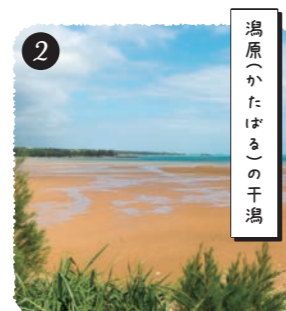
【松田区】 干潮時には約2キロの干潟が見れる