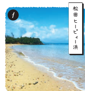
【松田区】 芝生や木陰もあるビーチは施設も充実