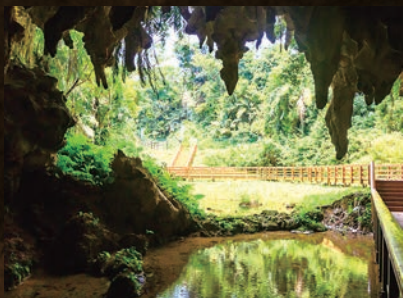
鍾乳石が創り出したダイナミックな風景に感動!