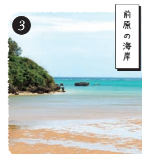
【松田区】 自然の海岸には四季折々の表情が