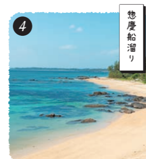
【惣慶区】 穴場お散歩スポットでのんびり