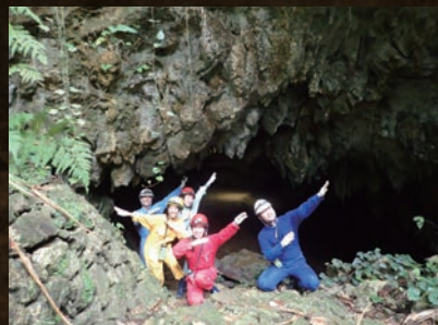
体験は10歳以上から。前日16時まで要予約